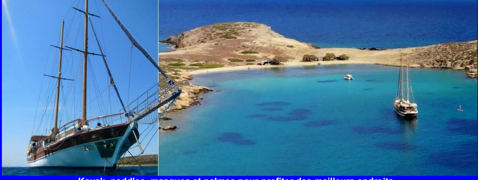
Kayak, paddles, masques et palmes pour profiter des meilleurs endroits...