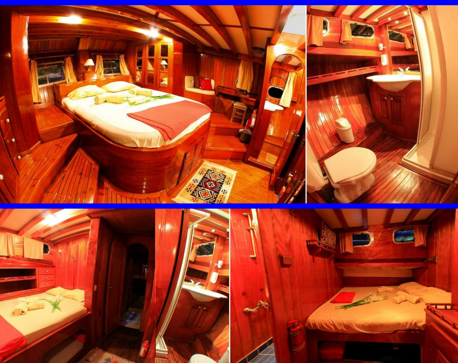
Toutes les autres cabines SUP disposent d'un lit de 160 cm de large et d'une cabine-douche, sauf la cabine A.