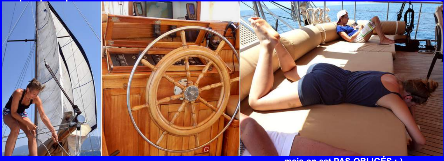
... mais on est PAS OBLIGÉS ;-)