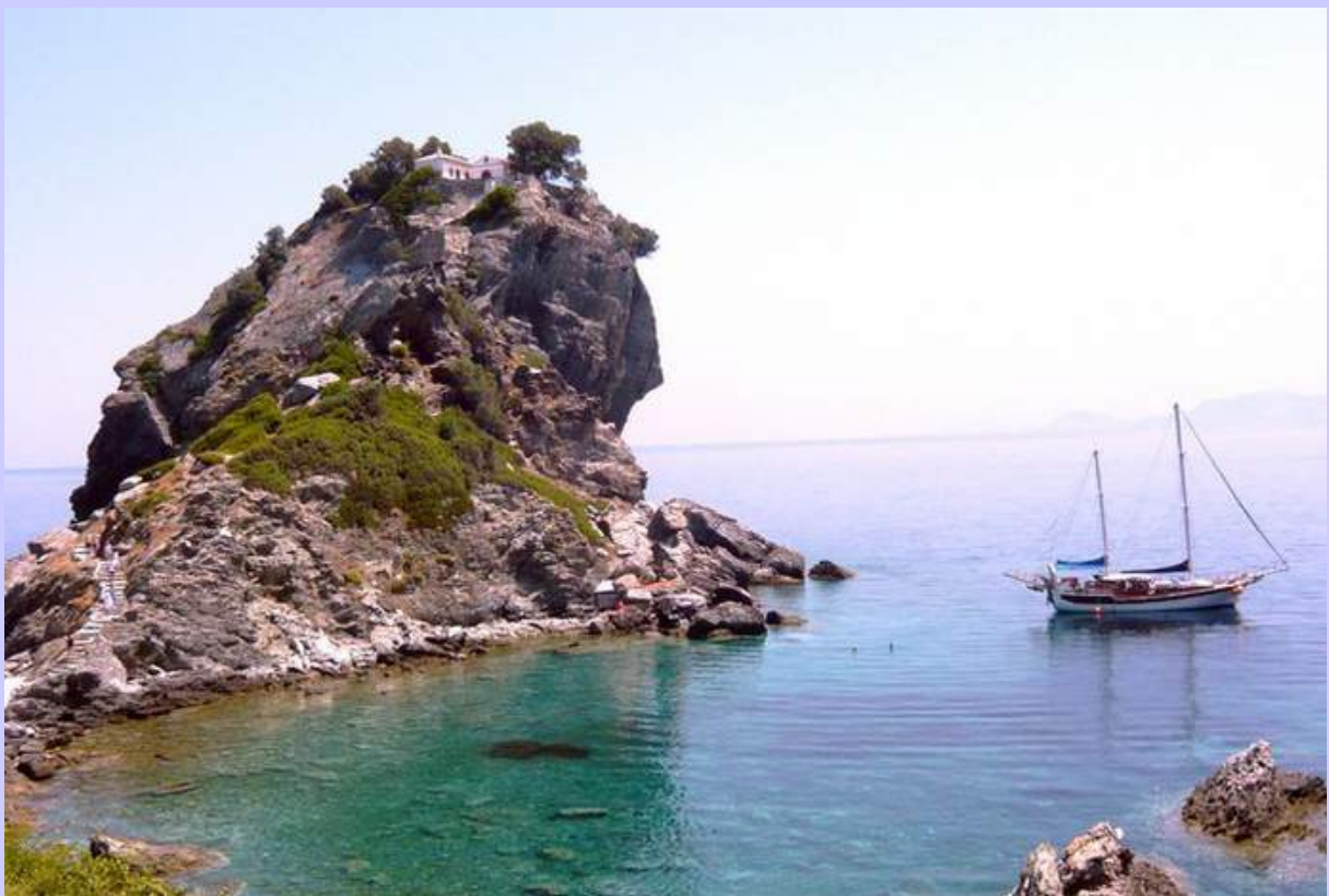
L'ANATOLIE à l'ancre sous l'église de "Mamma mia"

En demi-pension, pas de facturation au bar : boissons de base à libre disposition et possibilité d'amener ou acheter vos propres bouteilles. Le petit-déjeuner et un repas copieux à base de produits frais vous sont servis en demi-pension (apéritif et vins locaux compris).